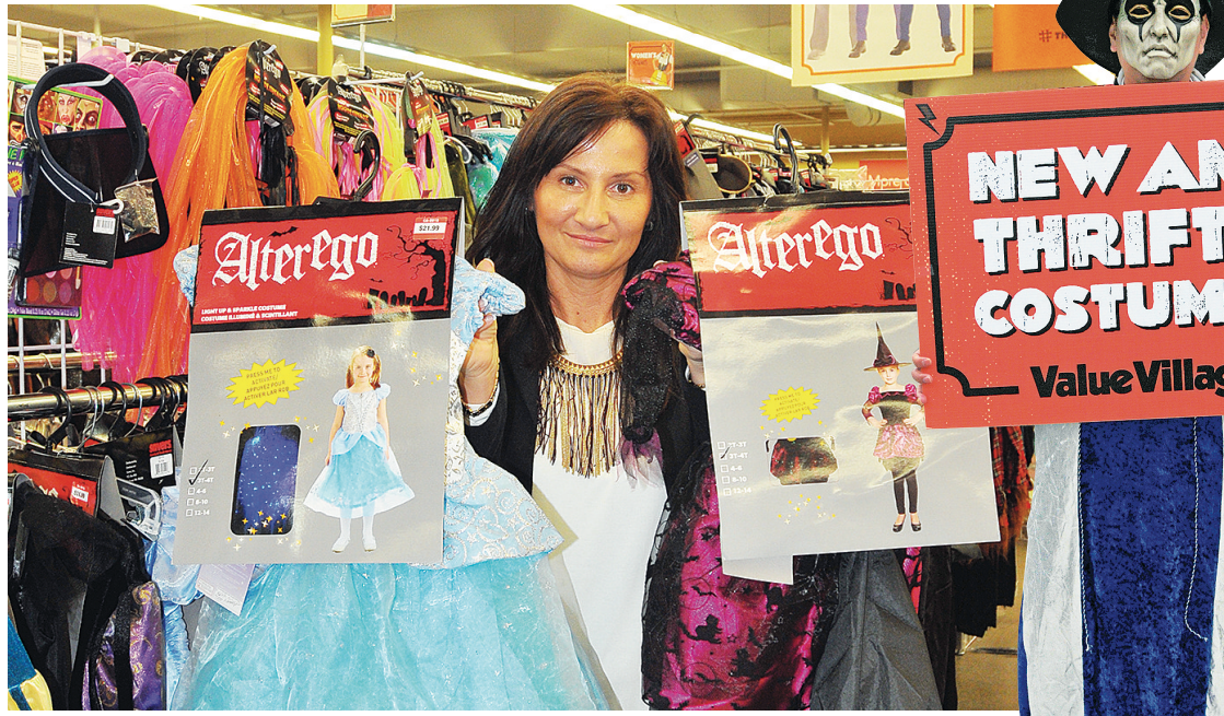
▲米斯里納茲稱店內萬聖節服飾已經售出7成，過半客人選擇二手服飾。 ▶周先生今年被臨時聘請在街邊促銷萬聖節服飾。

華裔居民羅女士為2歲的兒子購買了二手的恐龍裝扮服飾，花費不到10元。她說，如果買全新的可能需要20元左右，反正萬聖節服飾只穿一次