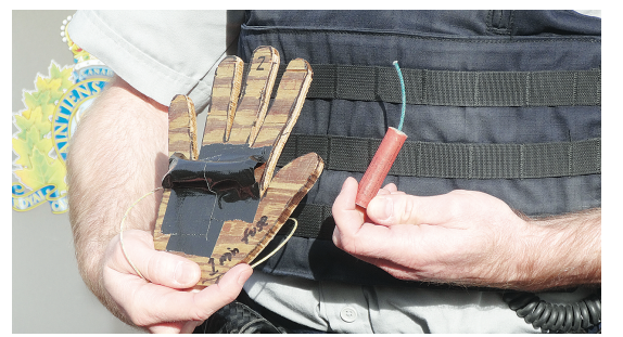
▲警方以木製「手掌」示範，在炮竹爆炸後，「斷指」等「手掌」殘骸四散。

(Frozen) 中 Elsa 與 Anna 兩位公主的造型今年依然火爆，上架僅一周已被搶購一空。該片的雪寶 (Olaf) 造型亦很受歡迎。另外，《權力的遊戲》(Game of Thrones) 以及《喪屍》(Zombie) 中的男女主角造型受到不少成年人追捧，而常年暢銷的女巫造型今年亦銷量不錯。