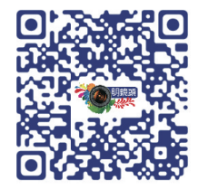
明鏡頭 QR Code