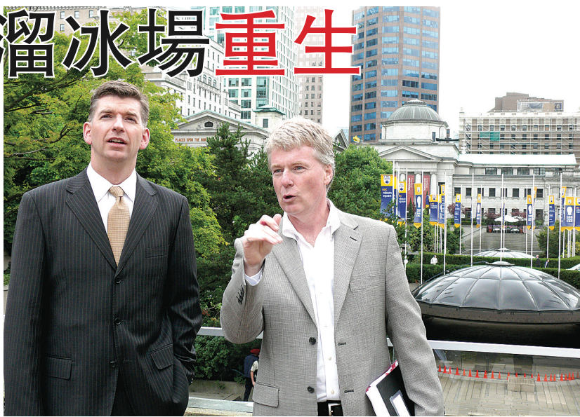
洛遜廣場改建工程第三階段即將開始，可能發出近兩個月的噪音。省勞工及公民服務廳長布萊克(左)昨日在工程發展經理布羅帶領下視察工程，兩人背後的廣場中心拱頂也在改建項目之列。(馮亮攝)

【明報專訊】溫哥華市中心洛遜廣場(Robson Square)的地下改建工程將於下周開始，施工期間造成的噪音可能會持續兩個月。省勞工及公民服務廳長布萊克(Iain Black)昨日參觀工地，宣布近期將就露天溜冰場重建計劃收集公眾意見。