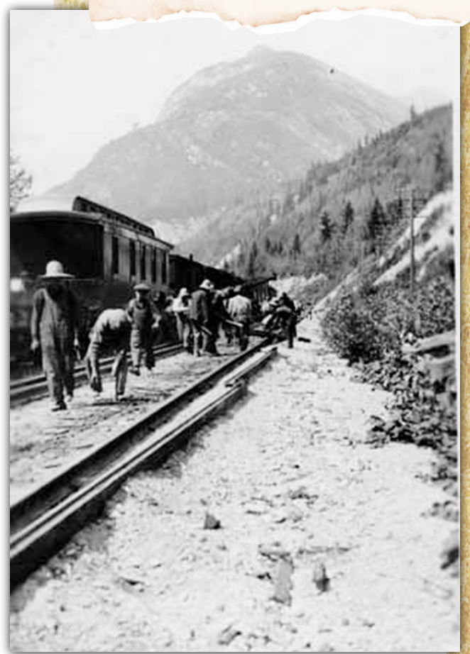
▲在Glenogle鋪設路軌的華工。

有關法案越權無效。省府起初計劃向樞密院（Privy Council）的司法委員會（Judicial Committee）上訴，但最後決定放棄這一行動。對於華人來說，這一宗官司的結果是一項重大的勝利。假若每人每年要繳交10元稅款，肯定會對卑詩省的大部分華人帶來難以承受的負擔。