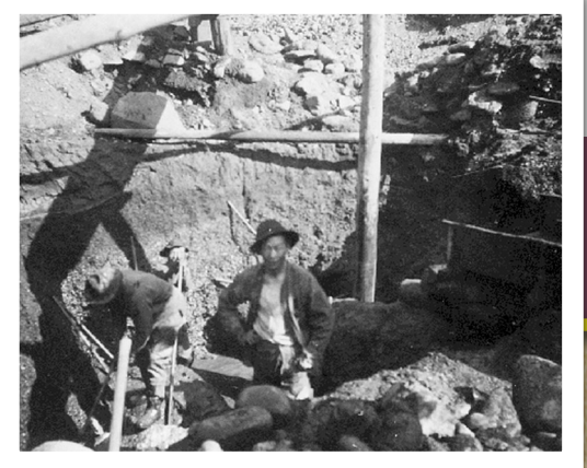
▲華人礦工負責輔助整理開採出來的煤。

」（Legislative Council of British Columbia）正式成立。