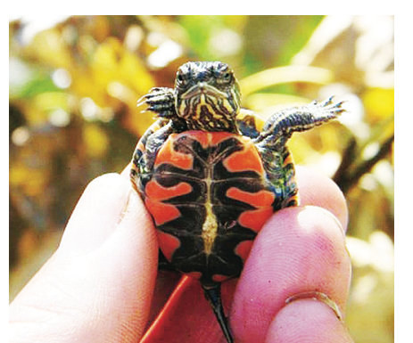
西部錦龜。(海岸西部錦龜項目)

錦龜可在凍僵情況下，經解凍而復蘇，基因非常特別，且非常長壽，在生命較後期仍具生育能力。牠們的壽命一般超過40年，雌性體長25厘米，雄性體長17厘米。