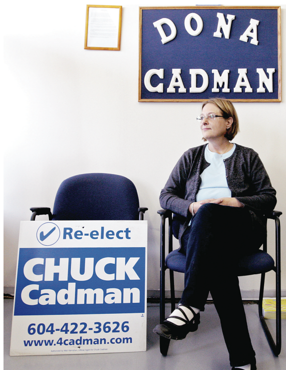
前保守黨國會議員卡德曼轉而支持自由黨。

【明報專訊】前保守黨國會議員卡德曼(Dona Cadman)宣布在這一屆選舉中，轉而支持自由黨。卡德曼曾是素里北選區的保守黨國會議員。