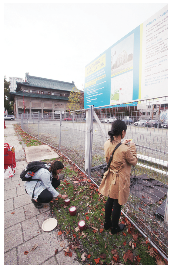
▲「憑弔」人士通過插香與綁繫黃絲帶，表達對華埠「過度」開發的疑慮。