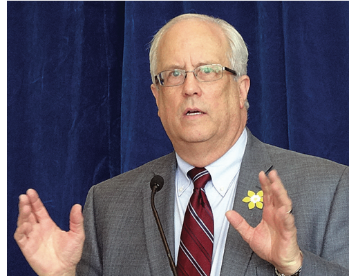
馬保定稱新車站是否興建，要看樓盤賣出的如何。