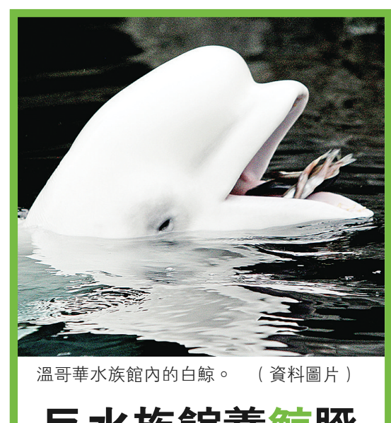
溫哥華水族館內的白鯨。(資料圖片)