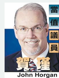
當值議員 賀瑾 John Horgan

隨着夏天即將來臨，本省許多年輕人將開始尋找工作。不論是尋找夏季短期工作，或是高中、專科、大學畢業生投入職場，都將面臨本省艱難的就業市場。