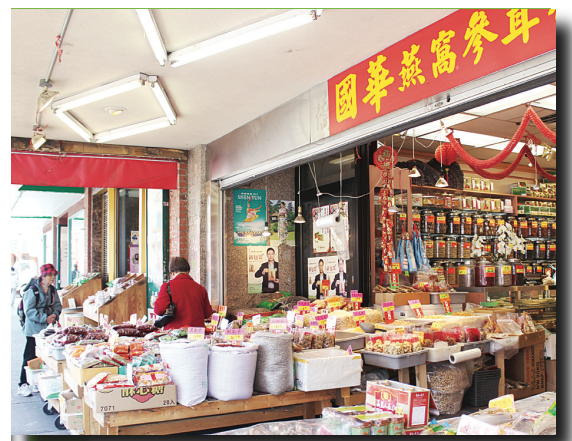
國華燕窩參茸行曾被租去拍電影。

另外，根據溫市府在2012年7月提出的報告，報告建議將天橋拆卸，興建一條連接市中心與緬街 (Main St.)、派亞街 (Prior St.) 的「超級地面道路」；增加附近公園及住屋面積達13%，市府說該計劃得到近7成市民支持。