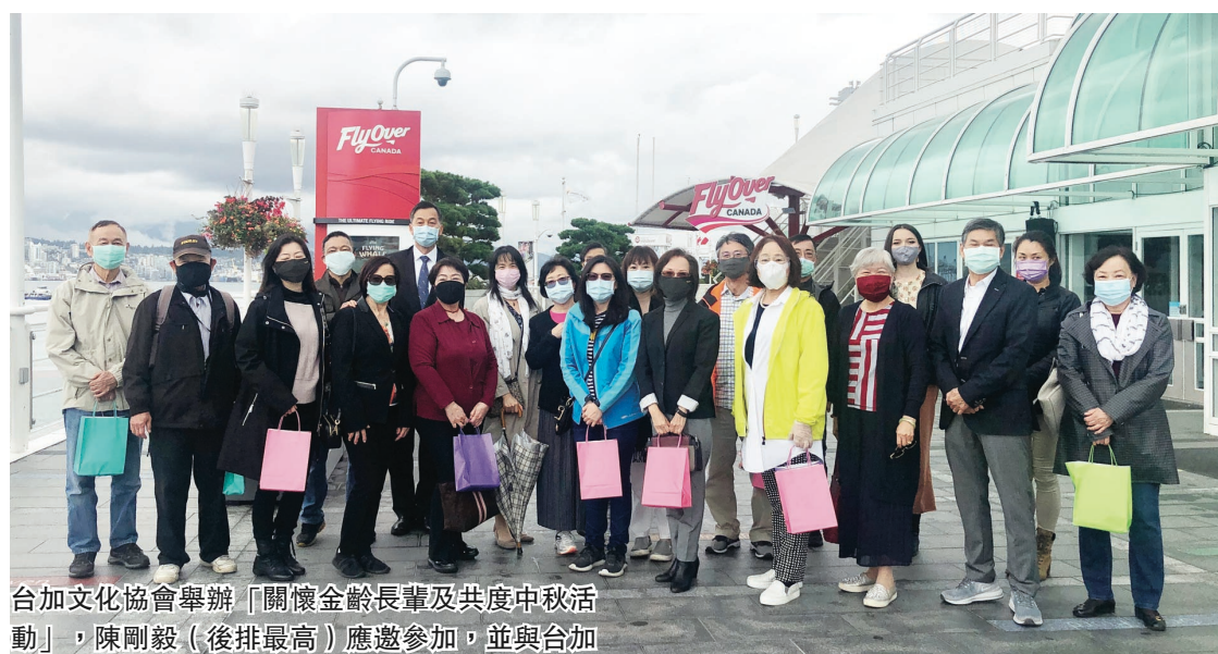
台加文化協會舉辦「關懷金齡長輩及共度中秋活動」，陳剛毅(後排最高)應邀參加，並與台加文化協會理事長林挺睦(陳剛毅右邊戴圍巾者)，以及參加的長輩們合影。

【明報專訊】台加文化協會上週六舉辦「關懷金齡長輩及共度中秋活動」，安排30多名長輩及家人體驗4D動感座椅配合超大銀幕「飛躍加拿大」(FlyOver Canada)，當日飽覽冰島的冰川美景。駐溫哥華台北經濟文化辦事處處長陳剛毅亦出席，與長輩們共度中秋。