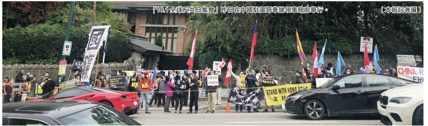
「10.1全球反共日集會」昨日在中國駐溫哥華總領事館前舉行。

【明報專訊】溫支聯響應「10.1全球反共日集會」昨日下午在中國駐溫哥華總領事館前進行。主辦方指，儘管本地疫情嚴峻，仍有約600人參加該次抗議，溫市警局亦派出多名警察維持秩序。