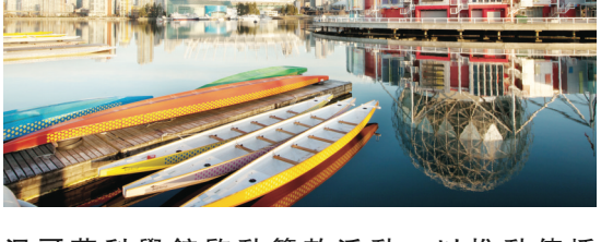
溫哥華科學館啟動籌款活動，以推動傳播「STEAM」知識。

【明報專訊】溫哥華科學館 (Science World) 宣布啟動一項 1000 萬元的籌款活動，以進一步將「STEAM」(科學、技術、工程、藝術/設計和數學)知識，擴展到全省和不同的社區。