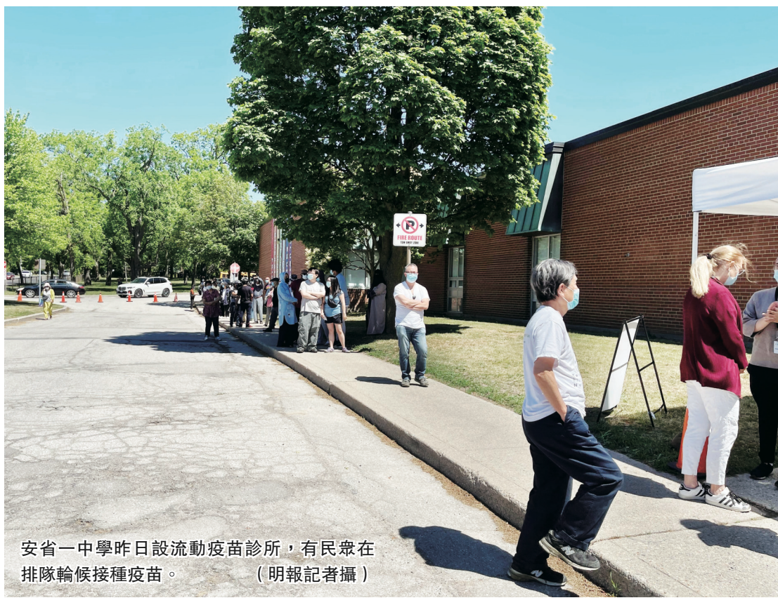
安省一中學昨日設流動疫苗診所，有民眾在排隊輪候接種疫苗。

Kalina 表示，公眾偏向輝瑞而不是莫德納可能是由當前數據造成的。他說，關於溝針的研究主要集中在阿斯利康和輝瑞疫苗的結合上。他說這是因為這些研究是在英國完成的，而那裏莫德納疫苗尚未被批准使用。他說：「但現實情況是，莫德納疫苗和輝瑞疫苗使用相同的技術，並且是非常非常相似的疫苗。最重要的是，你要盡快全面接種疫苗。」