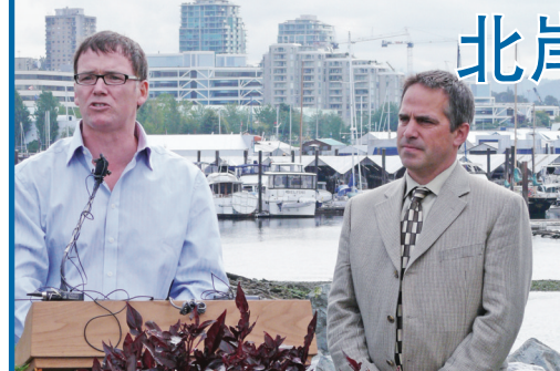
馮宜幹宣布省府將再為北岸步行及單車徑增撥100萬元款項，興建跨越加拿大鐵路的天橋；昨日將100萬元支票轉交北溫市長馬斯錫圖（右）。

【明報專訊】省運輸及基建廳長馮宜幹（Kevin Falcon）昨日代表省府宣布，為橫貫北岸的「北岸步行及單車徑」（North Shore Spirit Trail）項目，增撥100萬元，用於興建一座橫跨加拿大鐵路的天橋，方便民衆及單車人士。沿海岸從西端馬蹄灣（Horseshoe Bay）一直延伸至東端深灣（Deep Cove）的北岸步行及單車徑，總長度達35公里，由省府及北岸各市鎮政府合作興建，在增加了省府的撥款後，總預算達至450萬元。