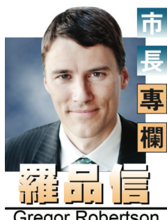
市長專欄 羅品信 Gregor Robertson

作為溫哥華市長及警務委員會主席，維護公眾安全一直是本人重視的議題。加拿大統計局上周公布的2012罪案嚴重指數(CSI)顯示，溫哥華市暴力罪案數字正在持續顯著下降，而下降速度更是全國之冠。