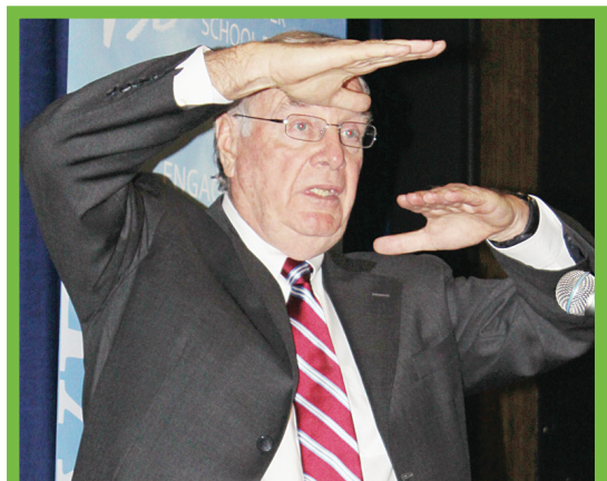
馬田表示「原住民青年創業計劃」提高原住民高中生的社會參與感。