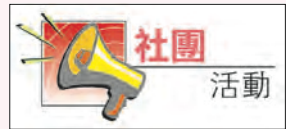
有卡拉OK,大會上有猜謎語活動。

●福慧寺定於二月十六日(星期日),舉行「新春祈禱供三寶諸天吉祥法會」,禮拜諸佛菩薩,祈願佛光普照,國泰民安,身心康和。法會於上午九時半至十二時舉行,歡迎各界人士到場拈香,同種福田。法會並備有供天吉祥結緣包,廣結善緣。福慧寺地址位於溫哥華哥利治街五四二八號,查詢電話六零四·四三零