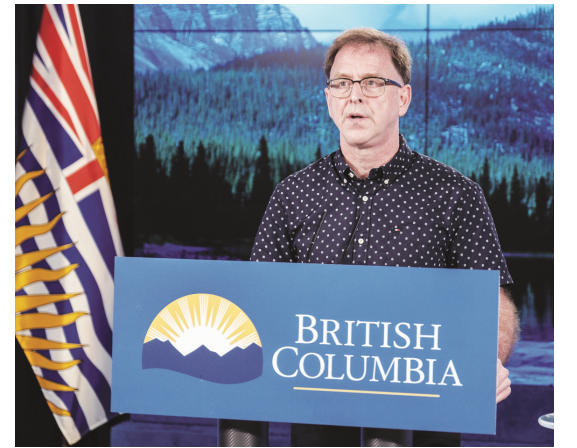
狄德安表示，省府已全面作好準備迎接未來幾天的另一股熱浪。

與此同時，由於卑詩省多個地區出現山火引起的煙霧，省民仍有可能因接觸煙霧而引致相關疾病。為減少接觸煙霧的機會，並且可以呼吸更清新的空氣，當局建議民衆在家中使用便攜式高效微粒（HEPA）空氣過濾器，前往社區中心或圖