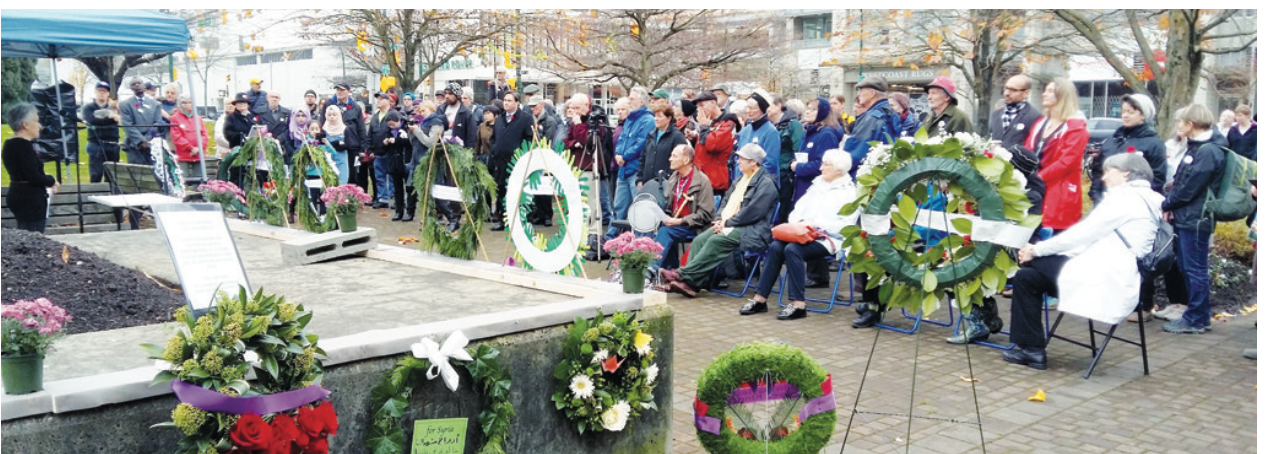
▼ 首屆紀念活動約有百餘名大溫各界代表出席。