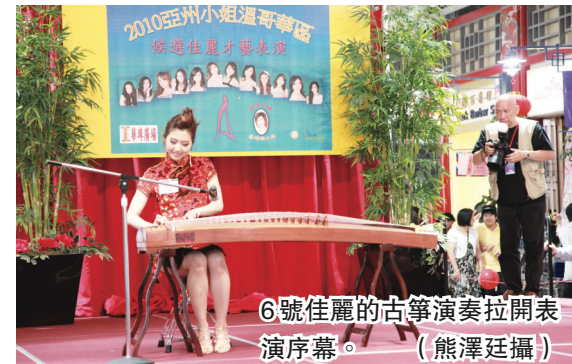
6號佳麗的古箏演奏拉開表演序幕。

【明報專訊】2010亞洲小姐溫哥華區選拔決賽即將展開，12名入選佳麗昨日到華埠廣場，為數百民眾提前上演了一場美麗與才藝的競賽。她們穩健的台風、自信的表情、優雅的體態，博得觀眾們熱烈掌聲。更有人稱佳麗們才貌雙全，為炎炎夏日帶來涼爽清風！