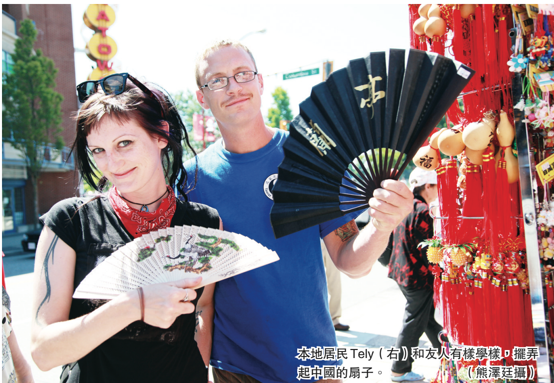
本地居民 Tely (右) 和友人一樣學樣，擺弄起中國的扇子。

【明報專訊】第11屆溫哥華華埠節昨日盛大開幕，吸引數千民眾到場參與。道地的中華料理、古色古香的手工藝品、威武雄壯的醒獅表演、還有樂趣橫生的各類遊戲，讓遊客們大飽口福的同時也過足「眼癮」，稱讚華埠節展現出一個活力四射、激情四溢的唐人街，成為「夏日溫哥華一道獨特亮麗的風景線！」。