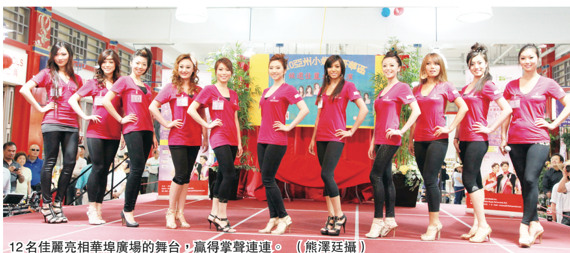
12名佳麗亮相華埠廣場的舞台，贏得掌聲連連。