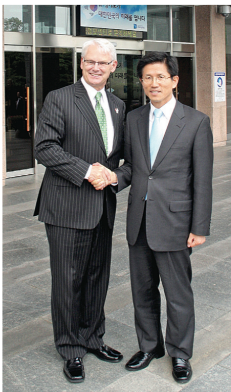
金寶爾 (左) 與京畿道省督 Moon-Soo Kim (右) 簽署姊妹省分條約。

與香港特區行政長官曾蔭權會面。蘇利文本周三 (香港時間) 將於香港總商會及加拿大總商會的會議