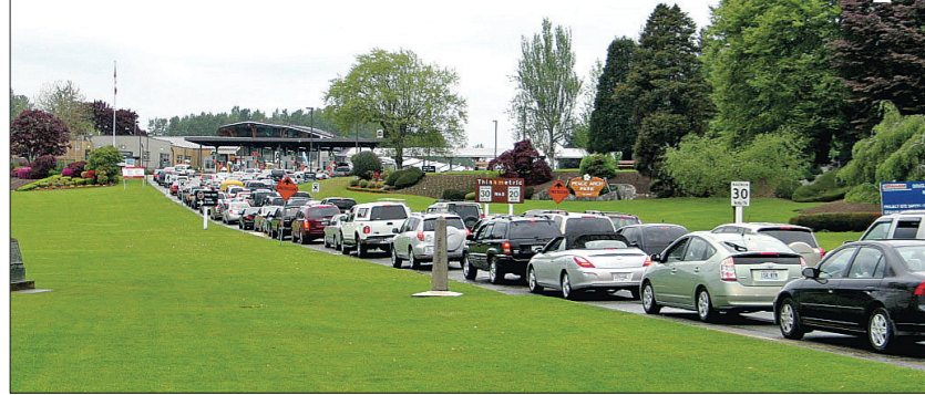
▲北上進入加國的車輛大排長龍。 ▼昨日下午去美國的車龍並不長，等候時間亦不算長。