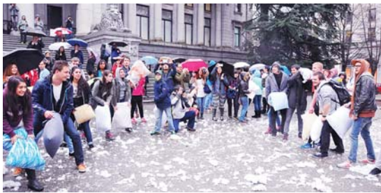
參加者排開陣勢作終極一戰。