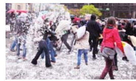
枕頭大戰打敗遍地「開花」。

【明報專訊】溫哥華市中心美術館門外昨日下午3時發生「枕頭大戰」，約有50至60名市民參加，吸引大批市民圍觀。參加者興高采烈揮舞手中不同款式枕頭，在雨上進行大混戰，部分單打獨鬥，部分聯群結黨「襲擊」其他人，就算被枕頭痛擊，仍然笑容滿面。