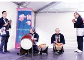
有日本傳統音樂樂隊為觀眾現場演奏。

有參加者更把枕頭打致「開花」，棉絮或羽毛四散落在參加者頭上和地面。他們最後不約而同排開陣勢進行終極一戰，以結束這場為時約30分鐘的枕頭大戰，不少華裔亦加入戰團。