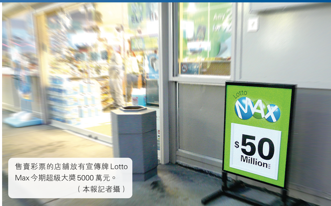
售賣彩票的店舖放有宣傳牌Lotto Max 今期超級大獎5000萬元。

與5000萬元相比算是「小兒科」，但100萬元絕對不是一筆小數目。根據彩票局預測，7個號碼全部都中的機率是2860萬分之一，今晚抽出的5000萬元和10個100萬元共11個獎，都必須是7個號碼全中。在7個號碼全中的情況下，5000萬元和100萬元如何分配？米勒就說，今天會抽出11個大獎，其中一個是5000萬元，另外10個100萬元。米勒又說，2005年有高達5430萬的彩金由多位阿省省民平分，當時創下加國史上最高彩金紀錄，今天總彩金高達6000萬元，再創新高。