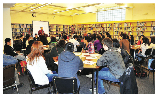
學生分組參與5個專題工作坊。

裔加拿大人, 她介紹日本之和平與和解運動。最後由卑詩史維會會長列國遠主持總結研討會成果。