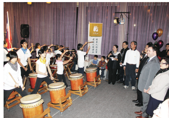
▲康尼（右二）欣賞台灣鼓表演。 ▲康尼（後排右二）與擊鼓的本地台灣小朋友相見歡。

康尼昨晚在列治文加華獅子會所舉辦的慶祝酒會上表示，台灣人在2007年至2009年間，僅有23人提出政治庇護的申請。台灣遊客在加國因為違反加國法例，而遭到遣返的人數也非常少。他強調，鑑於加國辦事處在台灣批准觀光簽證的比例非常高，加國台裔人士又持續向聯邦政府陳情，因此政府在經過仔細審查後，決定於上月22日取消對台灣遊客的簽證要求，並即時生效。