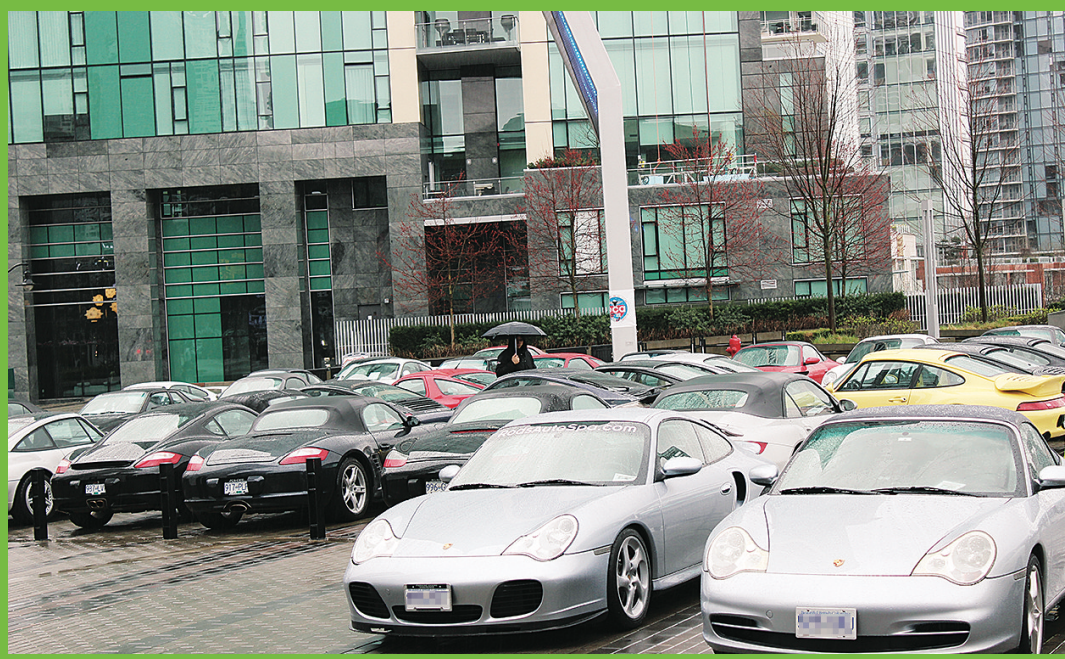
保時捷車主俱樂部將50多部保時捷開到會場外，聲勢浩大。