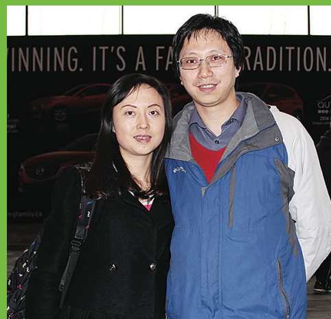
董先生(右)與妻子一家來車展，主要為滿足兒子好奇心。