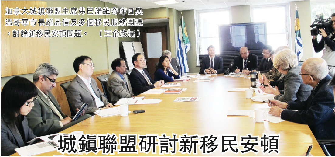
加拿大城鎮聯盟主席弗巴諾維奇昨日與溫哥華市長羅品信及多個移民服務團體，討論新移民安頓問題。

【明報專訊】中僑素里三角洲服務中心定於10月7日上午10時至12時，舉辦「如何使用卑詩省的醫療系統」講座，由菲沙衛生局公眾健康護士介紹本省醫療系統、如何找醫生和醫院、食物營養（加拿大食物指南）等。地點：中僑素里辦公室（206-10090 152 St. Surrey），查詢請電604-588-6869。