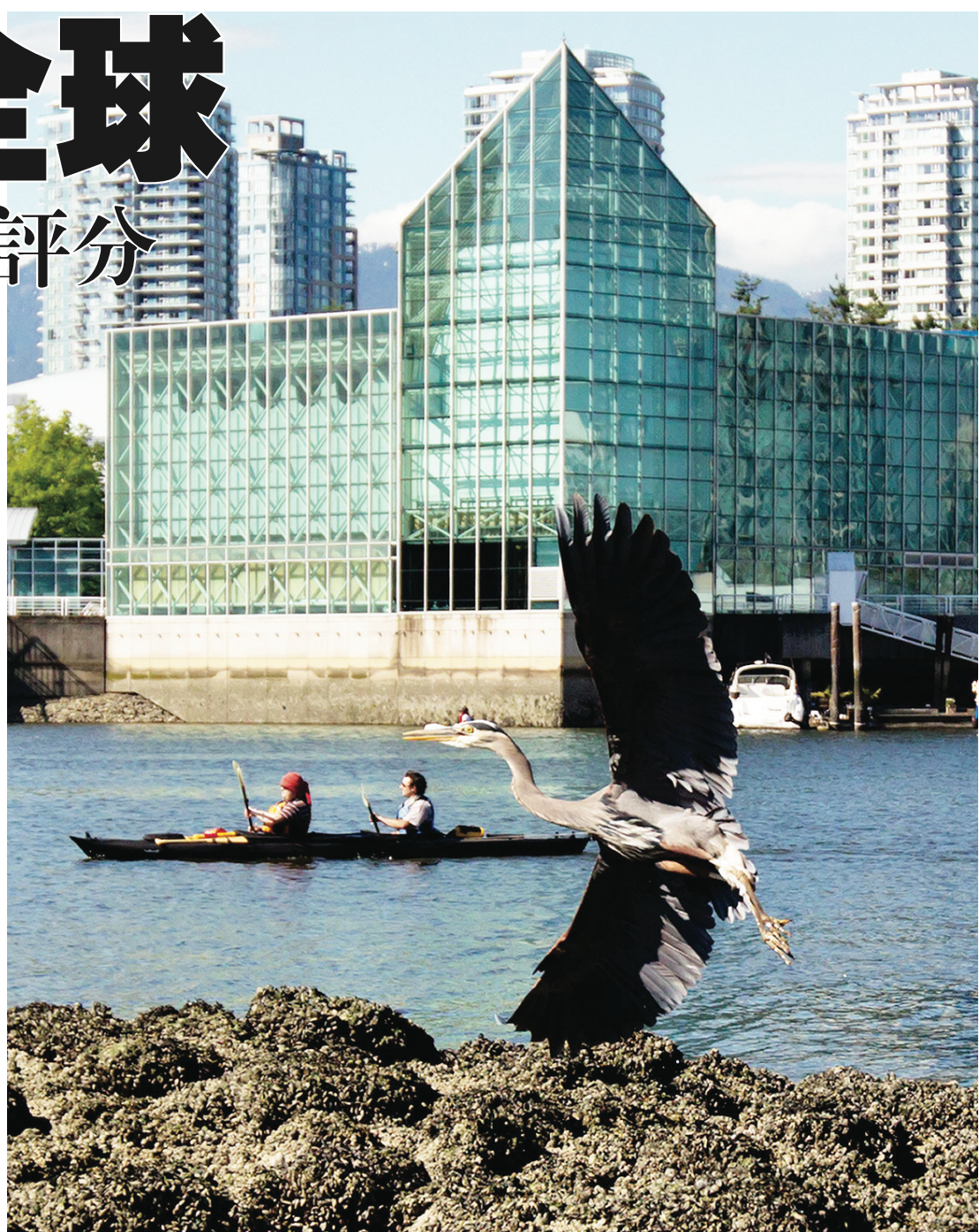
加拿大環境美麗，被評為最具聲譽國家。

文章作者指，在一些較落後、教育水平較低、失業率長期高企、較貧困的地區，居民壽命會較短。此外，較高的吸煙、酗酒、過胖比率，亦會縮短預期壽命。同時，作者亦指出，兩性之間的壽命差距，在低收入群中尤其明顯。