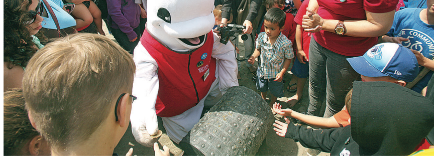
▲潛水蛙人將「找到」的藏寶圖交給「白鯨」。