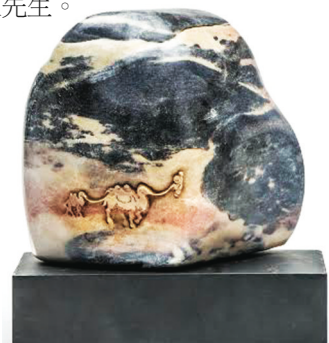
▲圖為冠軍獎品羅漢刻壽山石《任重道遠》薄意巧雕。

vip369@hotmail.ca，每人只限三聯，須具真實姓名及聯絡電話。截止收件日期為 4 月 30 日。查詢有關詳情，可致電 604-803-0369 陳先生。