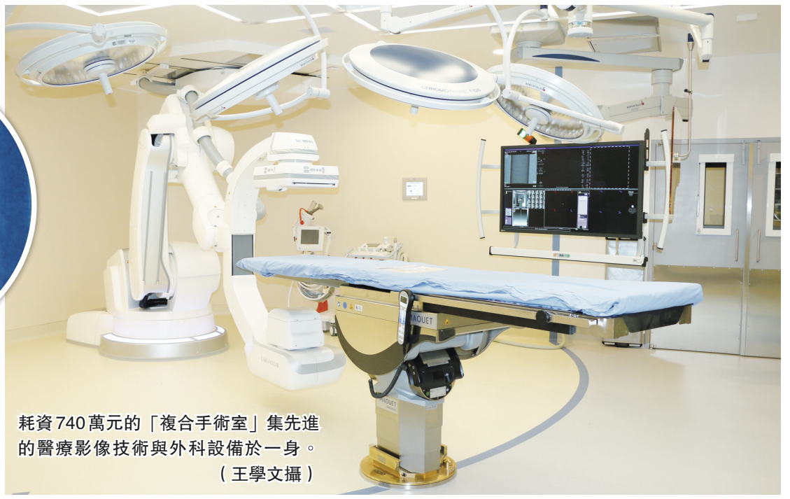
耗資 740 萬元的「複合手術室」集先進的醫療影像技術與外科設備於一身。