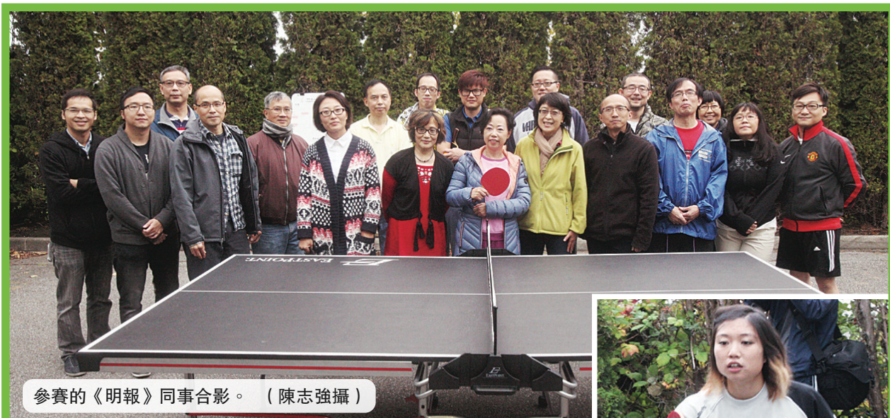
參賽的《明報》同事合影。