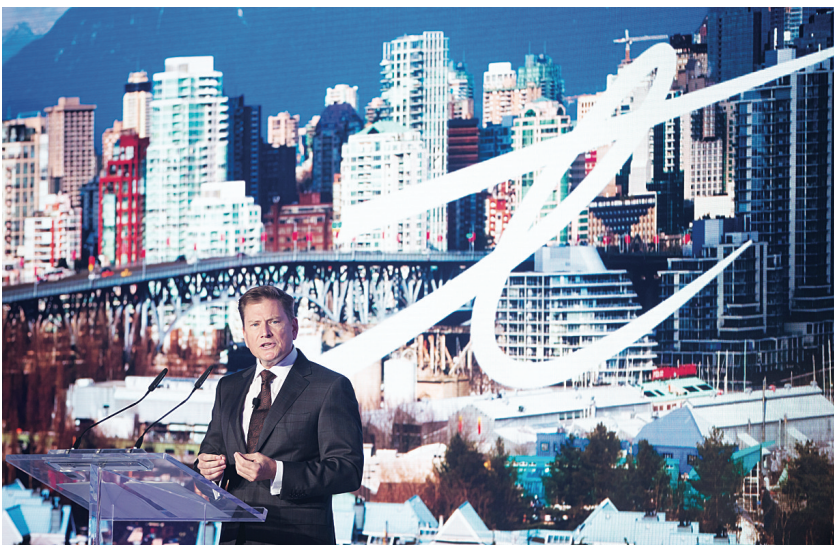
思特威爾公布投資10億元鋪設光纖網絡。

Telus 在本省包括高貴林港等22個城市社區安裝光纖網絡，並有計劃會在數個阿省和魁省城市，包括愛蒙頓安裝。