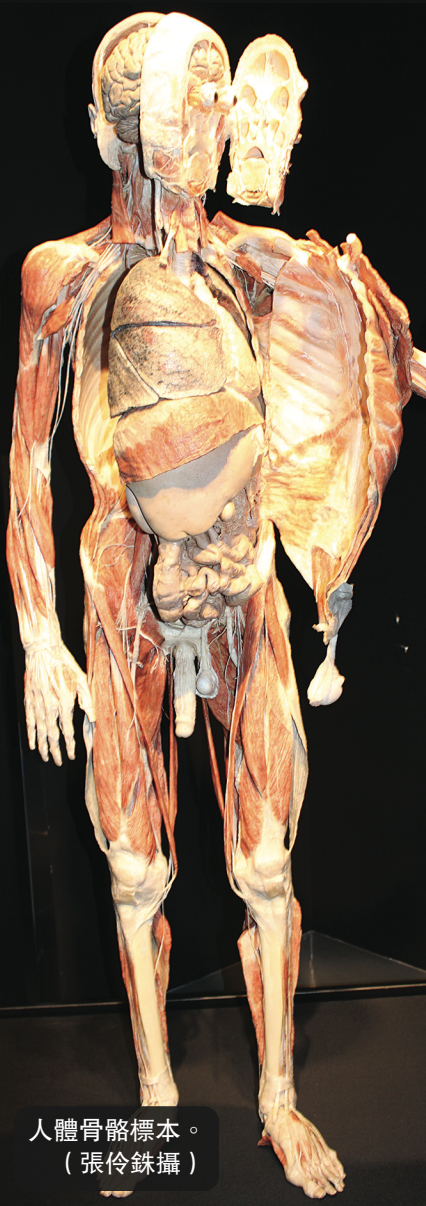
人體骨骼標本。

有關展覽收費及其他詳情，請上網至 www.scienceworld.ca/chinese 查詢。