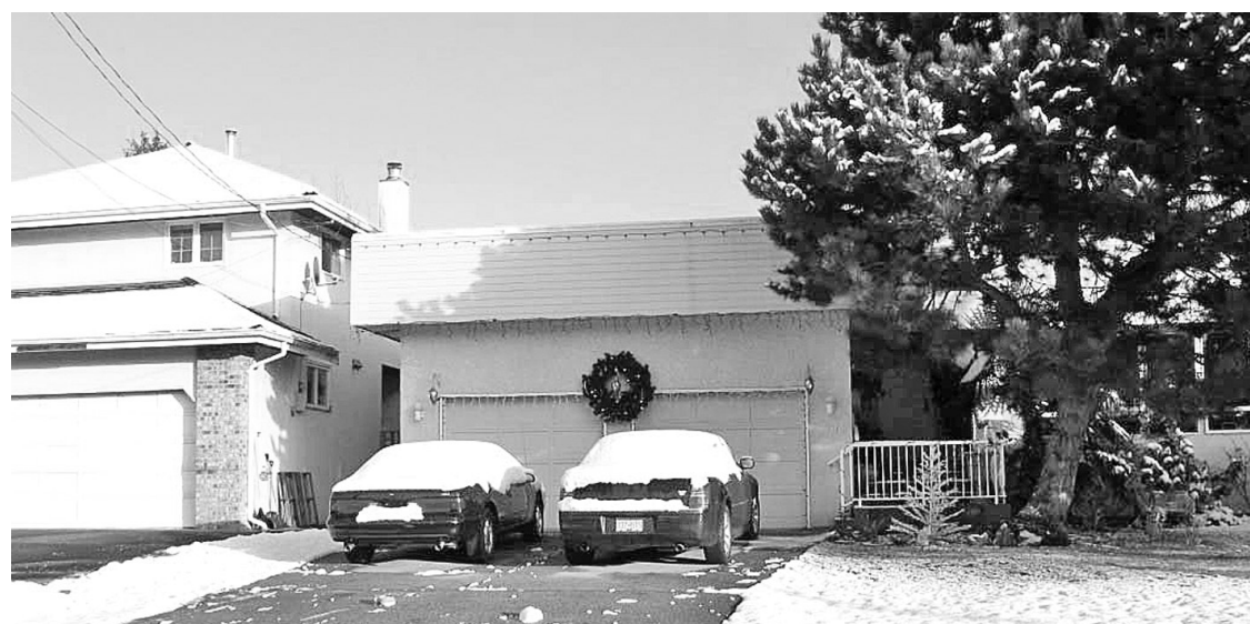
列治文教育局要出售的土地都不是空地，而是獨立屋，現在有租客。

【明報專訊】雖然樓市有所滑落，列治文教育局仍然在出售位在阿什街（Ash St.）和希瑟街（Heather St.）總面積約3英畝的7幅土地，並向列治文市政府申請變更土地用途，從獨立屋土地改為高密度、多單位住宅，希望在當地興建城市屋以及托兒中心，原則上得到市政府支持。