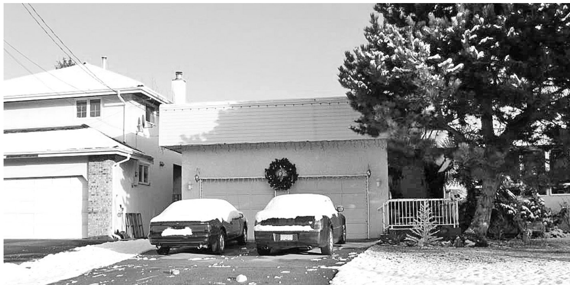
列治文教育局要出售的土地都不是空地，而是獨立屋，現在有租客。

【明報專訊】雖然樓市有所滑落，列治文教育局仍然在出售位在阿什街（Ash St.）和希瑟街（Heather St.）總面積約3英畝的7幅土地，並向列治文市政府申請變更土地用途，從獨立屋土地改為高密度、多單位住宅，希望在當地興建城市屋以及托兒中心，原則上得到市政府支持。