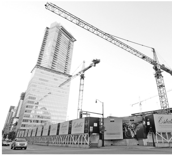
溫市政府報告指出，大型建築計劃的發展許可，一向是市府入不敷支的賠錢服務項目。

目前，阿什街和希瑟街7000號路段的四周有老舊的獨立屋和新建的城市屋，據估計，此7幅合計近3英畝的土地，可以興建120多個城市屋單位。