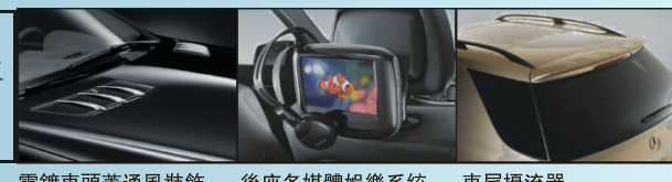
鍍鉻車頭蓋通風裝飾 後座多媒體娛樂系統 車尾擾流器

平治汽車「家家有平治」優惠計劃為閣下提供駕駛2011年款B系AVANTGARDE EDITION, C, ML系AVANTGARDE EDITION和GLK系最好時機，除首三月免供款/月租外，選購及安裝各項原裝平治後加配備更有25%折扣，B系及ML系各款前衛型號更為閣下提供分別超過$900及$3000免費配置，一個前所未有的優惠計劃，為免向隅，請即到大溫各平治陳列室試車選購。