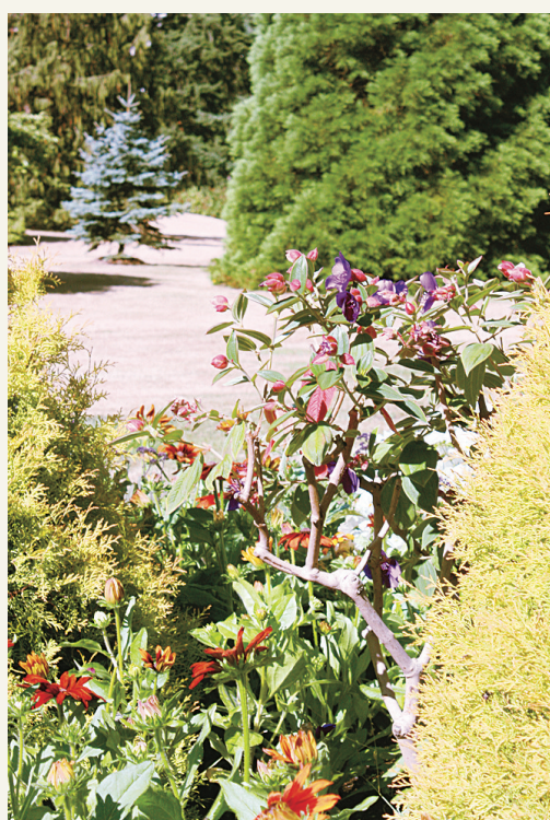
溫哥華的女王公園，於夏天百花盛放，吸引不少遊客。

旅遊業是卑詩省最具持續性產業，在2009年為本省製造了127億元的收入，為12.9萬人提供了就業機會。麥雅雯表示，這個月的國際遊客增長趨勢會為卑詩省帶來更多就業機會，而與中國簽訂指定旅遊目的地協議，將為卑詩旅遊業帶來不可估量的發展前景。