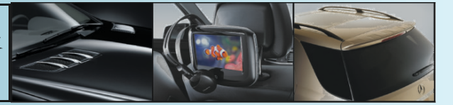
鍍鉻車頭蓋通風裝飾 後座多媒體娛樂系統 車尾擾流器

平治汽車「家家有平治」優惠計劃為閣下提供駕駛2011年款B系AVANTGARDE EDITION, C, ML系AVANTGARDE EDITION和GLK系最好時機，除首三月免供款/月租外，選購及安裝各項原裝平治後加配備更有25%折扣，B系及ML系各款前衛型號更為閣下提供分別超過$900及$3000免費配置，一個前所未有的優惠計劃，為免向隅，請即到大溫各平治陳列室試車選購。