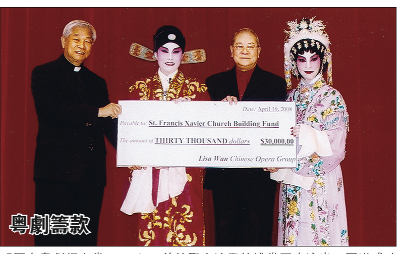
「麗友粵劇耀主堂2008」日前於聖方濟學校禮堂再次演出，圓滿成功，並為華人聖方濟社團籌得3萬元興建新堂善款。圖為支票頒贈儀式。