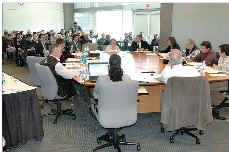
列治文市議會委員會批准夜市舉辦公眾意見諮詢會。

【明報專訊】列治文北邊河旁路(River Road)今年夏天舉辦夜市的申請再過一關，只要在本月20日通過公眾諮詢，便有可能在5月30日開業，但主辦者需要多付數萬元作為警察掃蕩假貨費用。