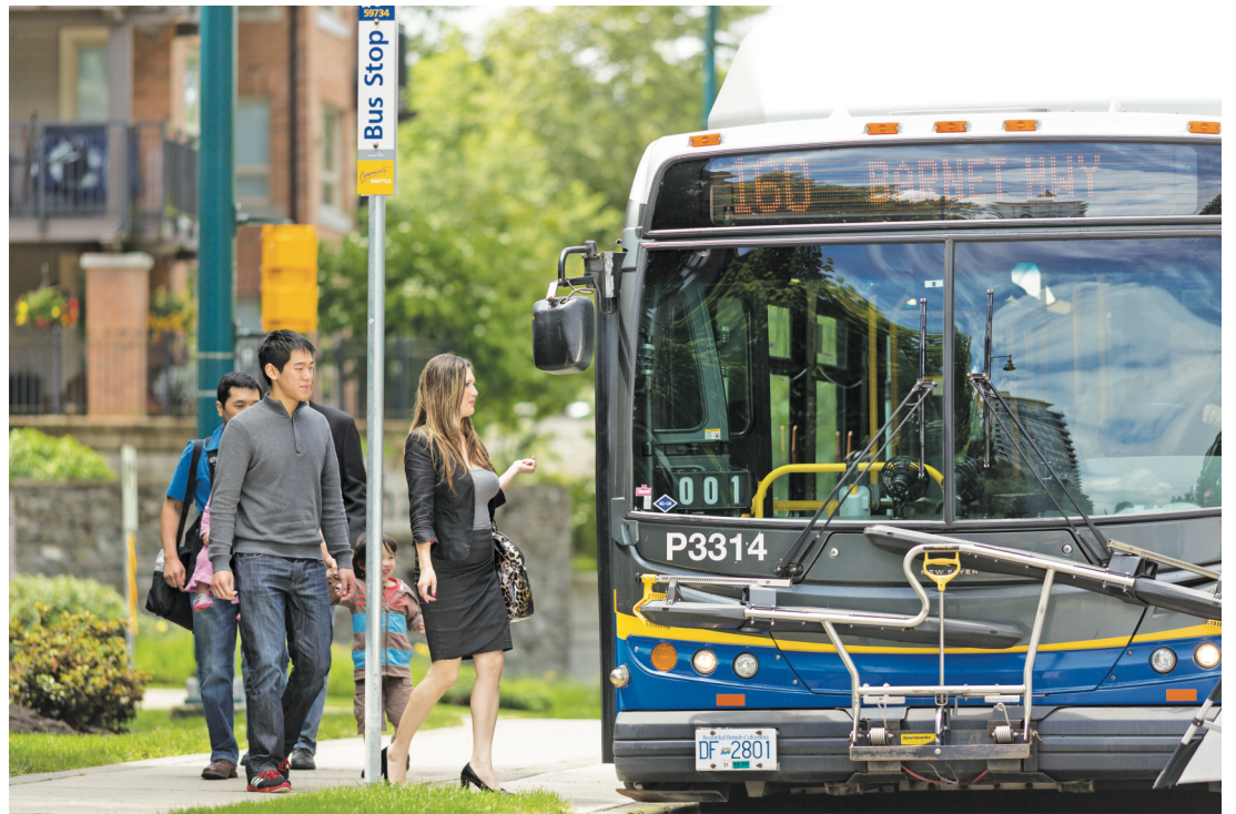
運輸去年的乘客量再破紀錄。