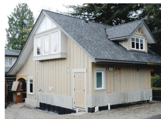
西溫鼓勵獨立屋業主興建「車房屋」以增加房屋供應。

【明報專訊】西溫市議會針對為市民患病多年的「怪獸屋」問題，通過修改獨立屋的房產密度政策，將獨立屋「地積比率」(FAR, floor area ratio)降低，今後1萬呎土地可興建面積，將從原來3500呎降低至3000呎，減少可建面積。這是西溫30年第一次修改獨立屋的房產興建面積。