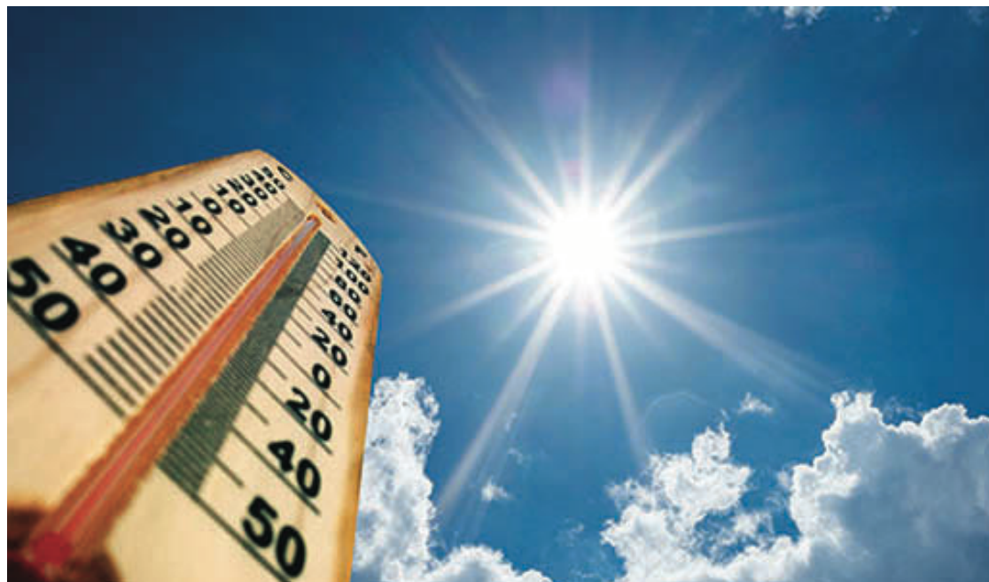
環境部指大溫地區的日常氣溫於未來數天會突破30度。

環境部表示，一股高壓將於今日形成，並預計於周四和周五達到最大強度，導致氣溫升高。這股熱浪預計維持最短三天，而由於熱浪在晚上不會得到顯著的緩和，晚間氣溫也有明顯上升。這些高於平常的氣溫可能會提高出現酷熱引發疾病的風險，所以環境部提醒民眾，確保自己和親友