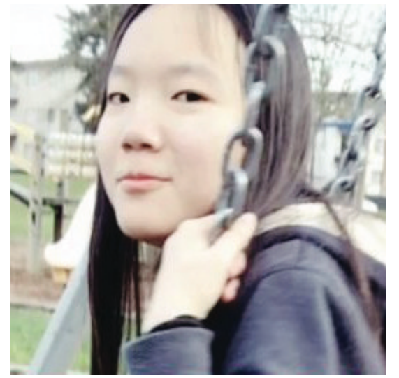
申小雨案庭審再度延期。

麥克勞克林在電子郵件中提醒，謀殺案中的被告亞里，與另一名在2016年因涉入一宗致命車禍之後不顧而去，最後被捕的另一名男子的名字和出生年份相同，容易引起混淆。