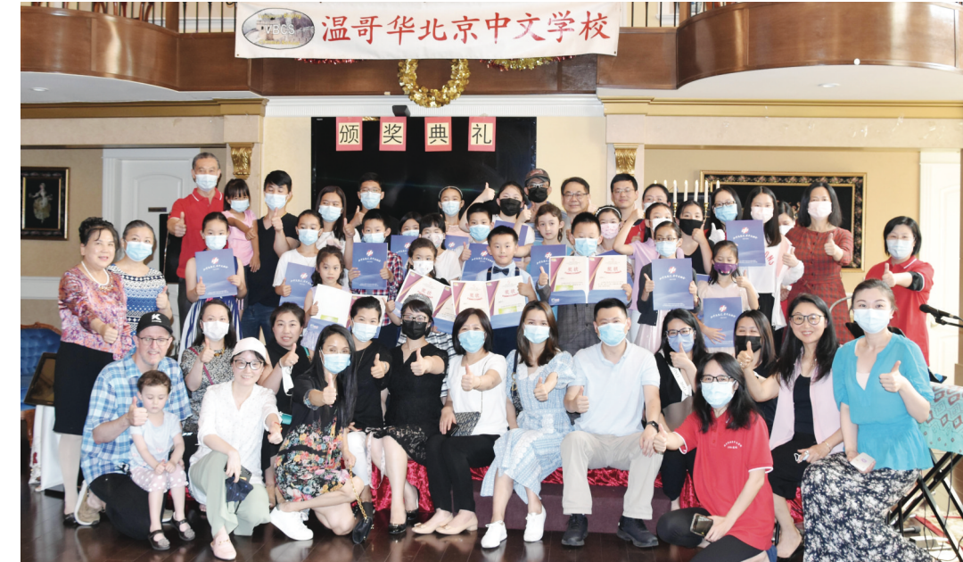
溫哥華北京中文學校8月1日為參加第二屆《青少年網絡詩歌朗誦大賽》的同學舉行了線下頒獎典禮。