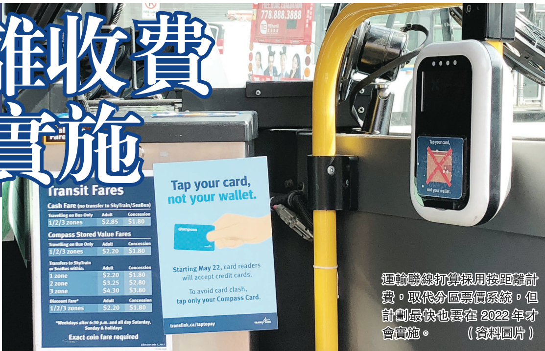
運輸聯線打算採用按距離計費，取代分區票價系統，但計劃最快也要在2022年才會實施。（資料圖片）

運輸聯線還宣布，將建立一個由民衆組成的新客戶諮詢小組，以確保該機構在經歷重大擴張時