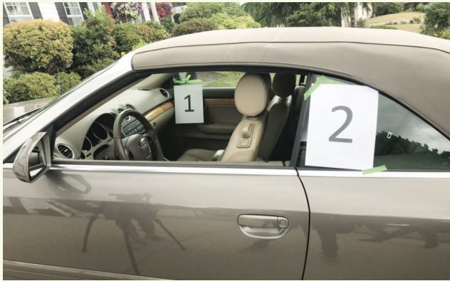
▲警方指出晚上9時後需要注意的防盜要點。