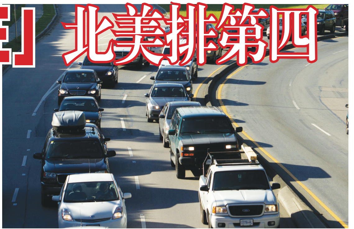
溫哥華被指為全國最塞車城市。

報告又指，溫哥華自2010年以來，首次錄得塞車指數下跌，這可歸功基建投資和交通管制的改善。