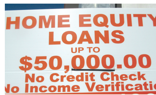
家庭負債水平不斷上升，早已引來關注。

總理杜魯多對此看法表示認同。他說，加拿大需要創造經濟增長的機會，以及提高理財知識。