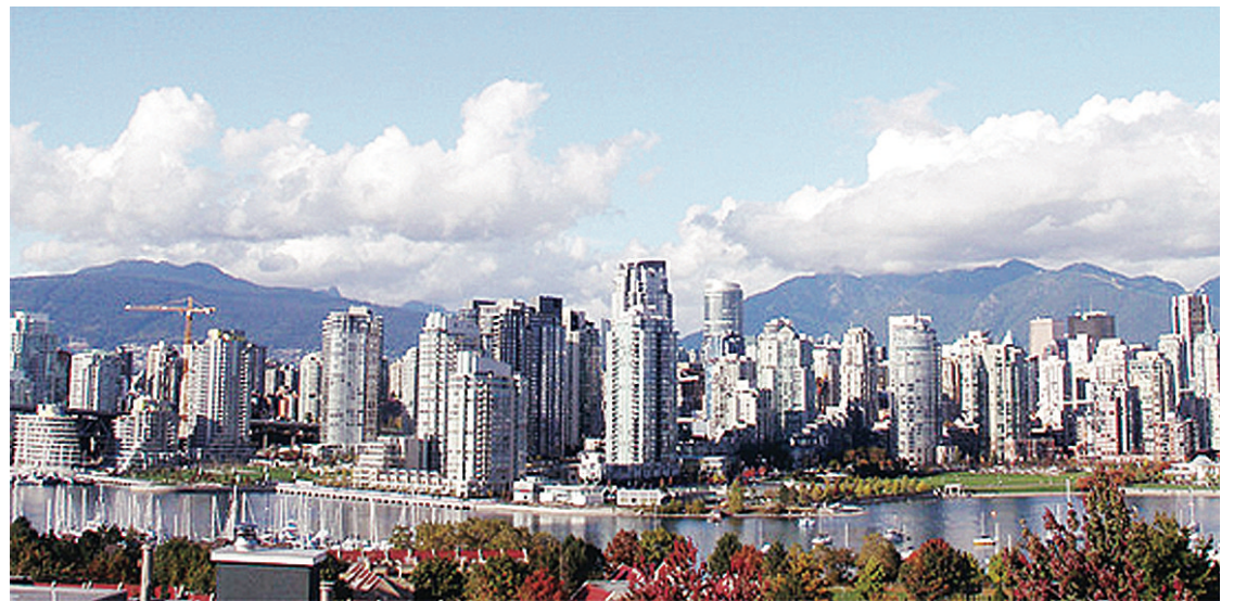
溫哥華雖然最宜居住，但可能因物價昂貴及置業困難而導致市民不开心。

報告指出，原住民的生活滿意度要比整體加拿大人稍微高一點；當被問及健康、工作和收入時，評分則低於全國平均水平。