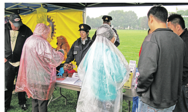
騎警攤位引起不少市民的興趣。

列治文消防局則將大型消防車開到現場，供市民參觀了解消防員的工作。列治文皇家騎警也在場擺有招聘及相關警務的攤位，並安排中文翻譯，吸引大批市民前來詢問並索取相關資料。