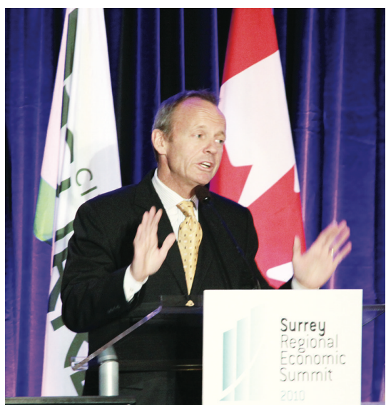
戴國衛昨日在素里經濟高峰會發表演說。