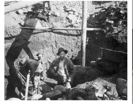
▲ 華人礦工負責輔助整理開採出來的煤。

」（Legislative Council of British Columbia）正式成立。