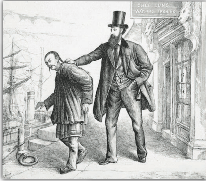
▲ 1879年加拿大刊物《Canadian Illustrated News》曾經以卑詩華人受排擠的卡通作為封面。

但華人在淘金上的成功，沒有換來應有的尊重。卑詩省誕生之後的第6年，也就是1872年，省議會便立法，剝奪華人的投票權。將華人成為正