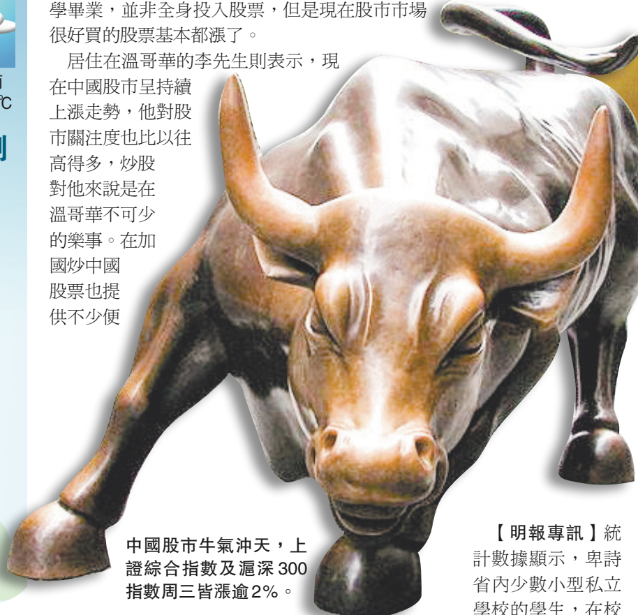
中國股市牛氣沖天，上證綜合指數及滬深300指數周三皆漲逾2%。