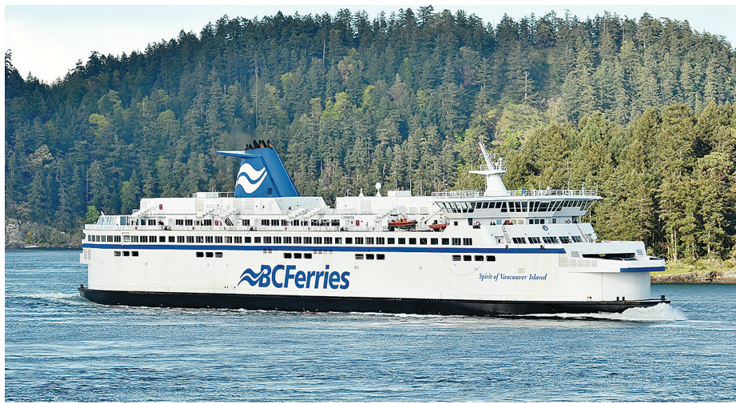
卑詩渡輪下月推出優惠，指定航班的汽車船票減至半價。

【明報專訊】卑詩渡輪 (BC Ferries) 下月再度推出為期約一個月的減價優惠，這是本年內第二次大型推廣活動。乘客於指定非繁忙時段，可享有汽車票價 (Vehicle Fare) 半價優惠，但乘客票價不變。