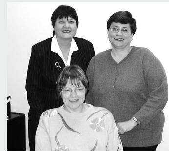
Miss Joan Miss Ann Miss Pat