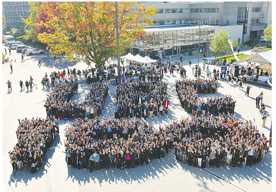
數百名學生、教職員工和校友在中心旁廣場拼出「UBC100」隊形慶祝建校百年。