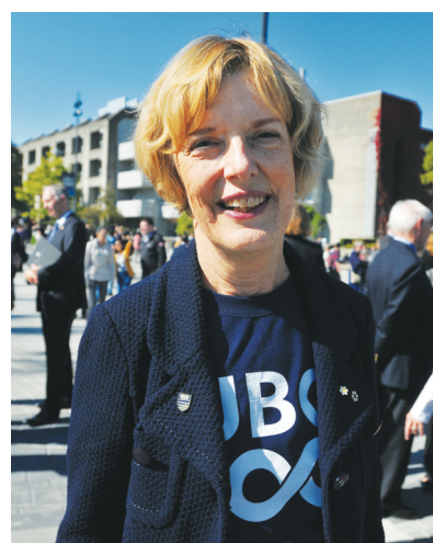
圖)昨日親自加入隊列，與數百名校友共同拼出「UBC100」隊形。她說，卑大在全球120多個國家擁有逾30萬名校友，他們活躍在各個領域，很多校友為社會作出非常突出的貢獻。

卑大校友中包括2名加拿大總理、7位諾貝爾獎得主。卑大教師、校友及研究者還獲得69項羅德學人獎學金(Rhodes Scholarships)及65枚奧林匹克獎牌。