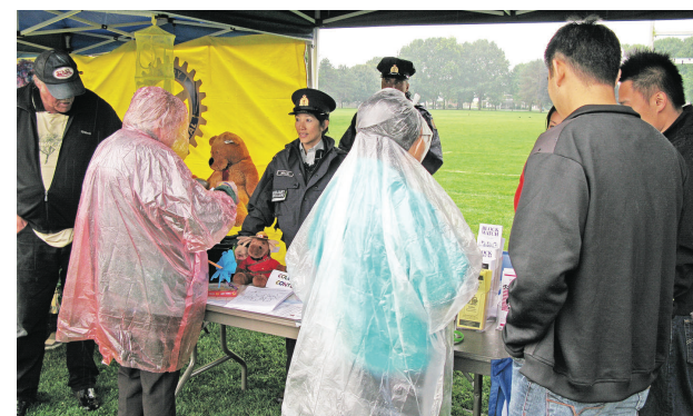
騎警攤位引起不少市民的興趣。

列治文消防局則將大型消防車開到現場，供市民參觀了解消防員的工作。列治文皇家騎警也在場擺有招聘及相關警務的攤位，並安排中文翻譯，吸引大批市民前來詢問並索取相關資料。