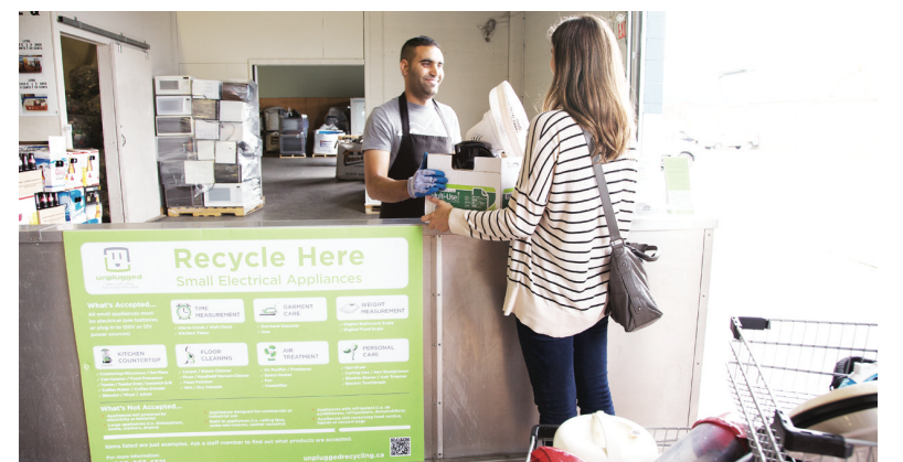
下月1日起將有120種小型家電，被納入可回收物品，屆時民眾購買這些電器需繳付回收費。