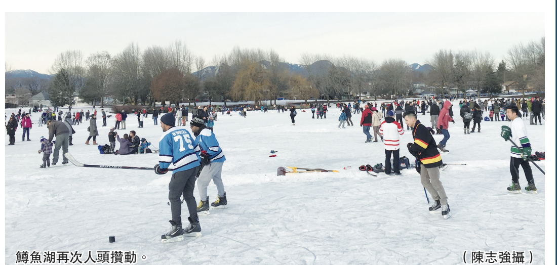
鱒魚湖再次人頭攢動。

若對計劃有興趣，或想知道更多詳情，可發電郵至 info@bcartscape.ca。