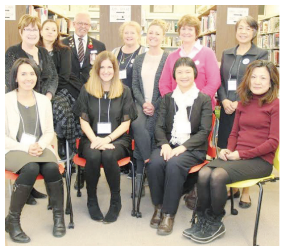
▲主持研討工作坊的資深老師共 14 名，此為部分老師合照。