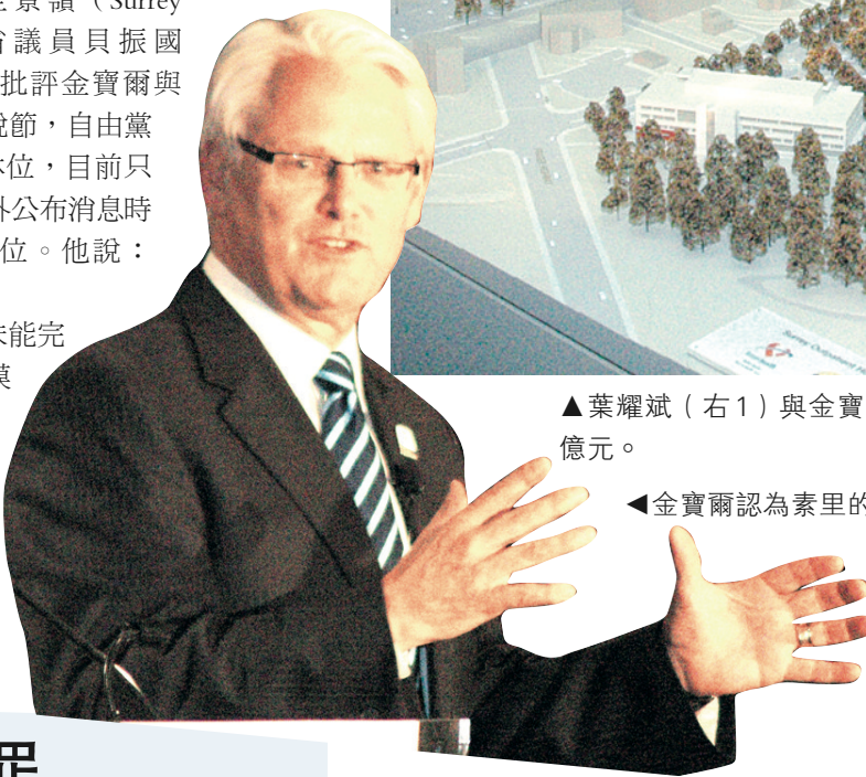
◀金寶爾認為素里的經濟發展潛力無限。